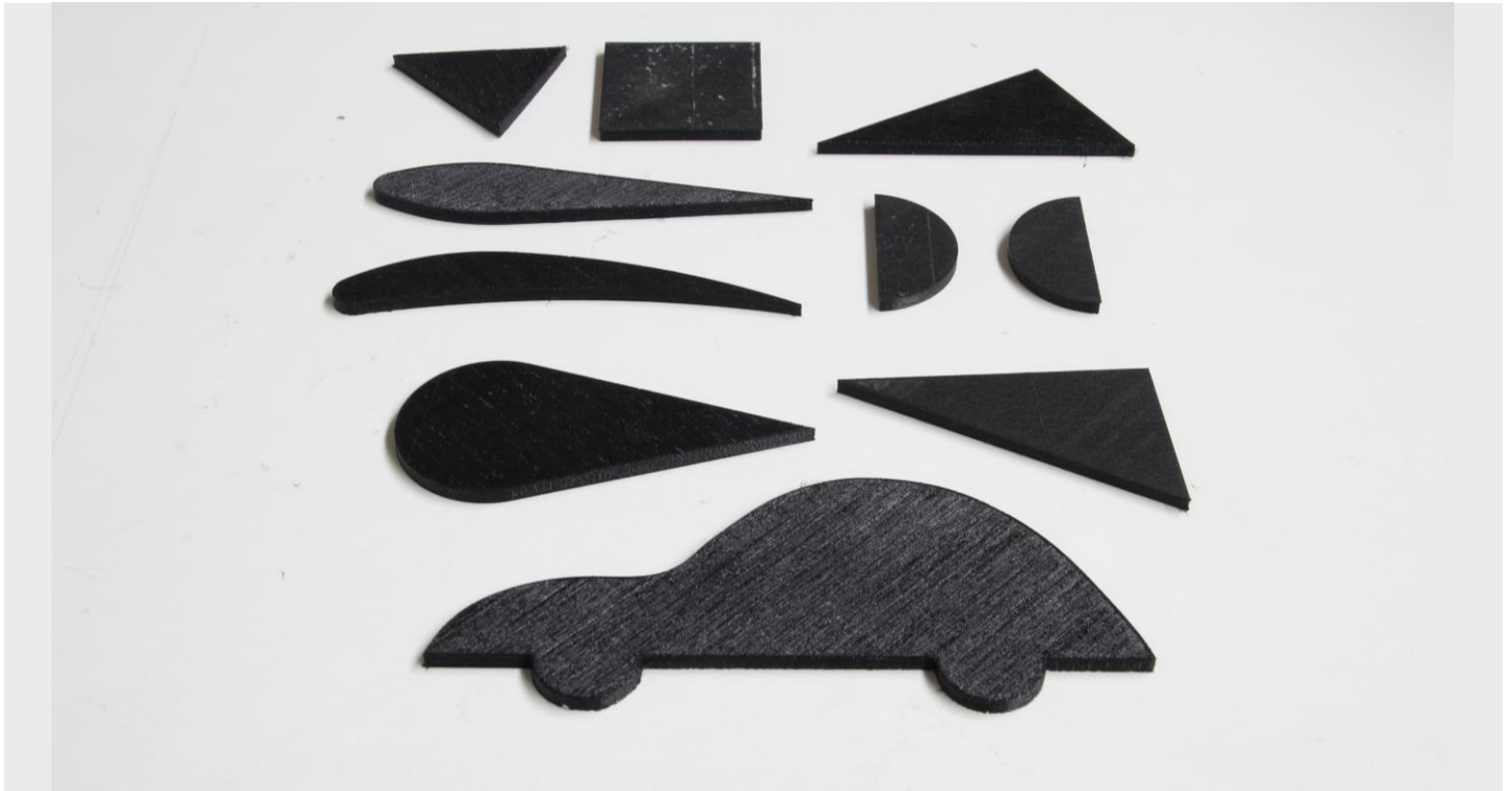
The equipment includes diferent models: car profile, aerodynamic profile, circle, rectangle, square, etc.