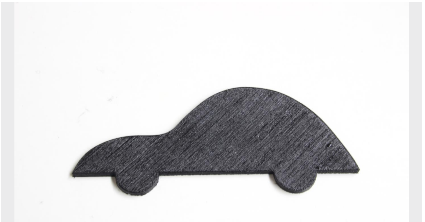
Car profile model.